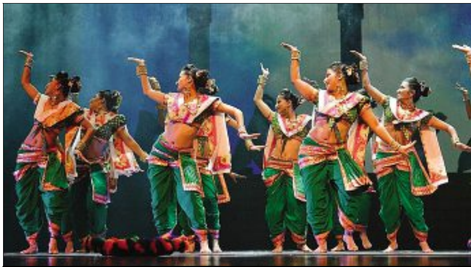
VOYAGE. Chorégraphies et mélodies envoûtantes attendues mercredi au Zénith.

➔ Pratique. Mercredi 4 décembre, à 20 heures, au Zénith. Tarifs : de 33 à 49 euros. Locations dans les points de vente habituels.