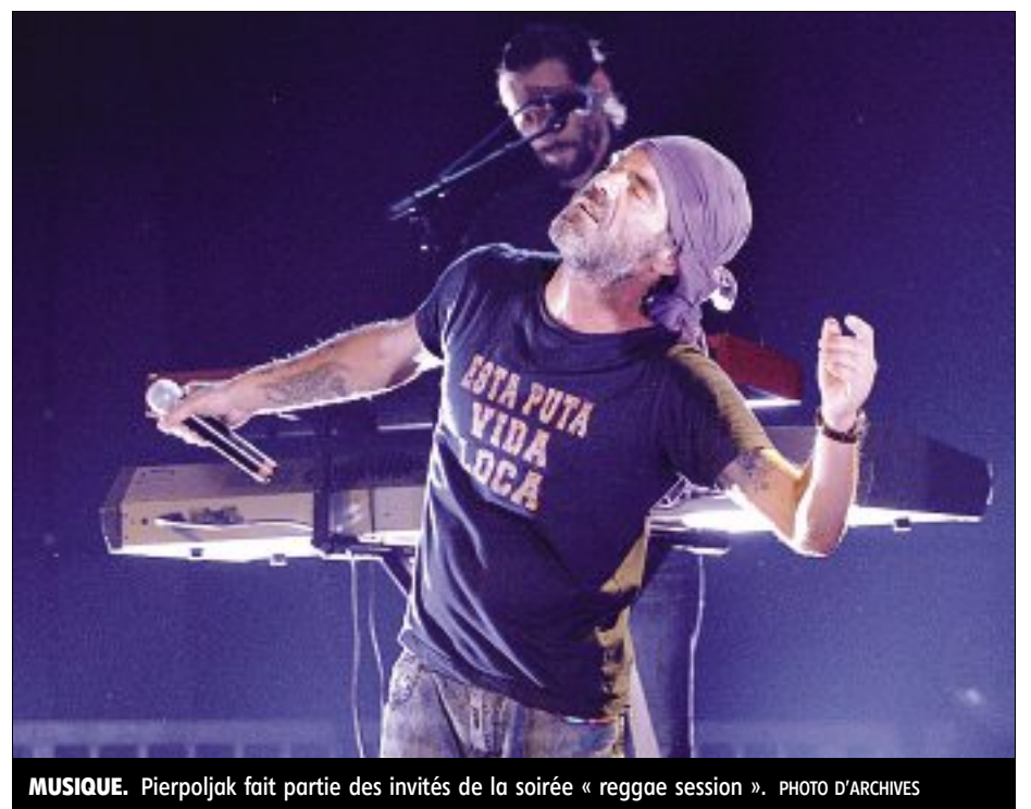
MUSIQUE. Pierpoljak fait partie des invités de la soirée « reggae session ».

L'association Musique et sourire organise, samedi, un grand concert reggae en réunissant sur scène quelques artistes du genre, incontournables.