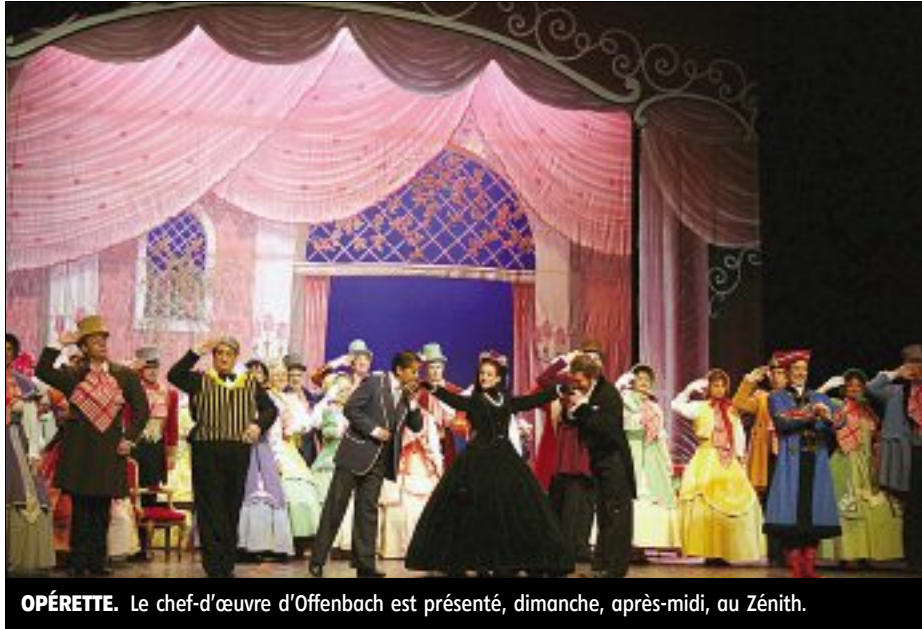
OPÉRETTE. Le chef-d'œuvre d'Offenbach est présenté, dimanche, après-midi, au Zénith.

La vie parisienne, voilà ce que veut découvrir un baron suédois qui débarque dans la capitale. « La vie parisienne », voilà ce que va découvrir le public du Zénith d'Orléans, dimanche après-midi.