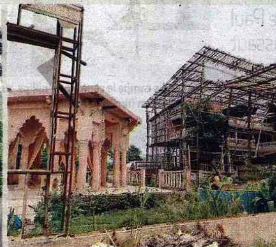
Les studios en plein air abritent des répliques en carton-pâte de monuments indiens.