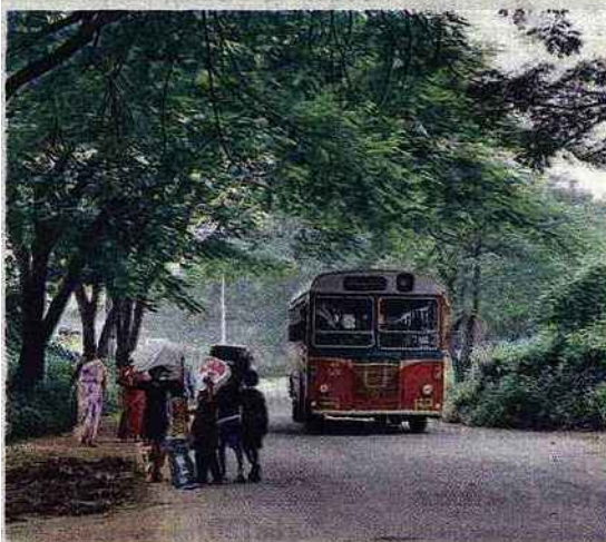
Scène de la vie quotidienne aux portes des studios bollywoodiens.